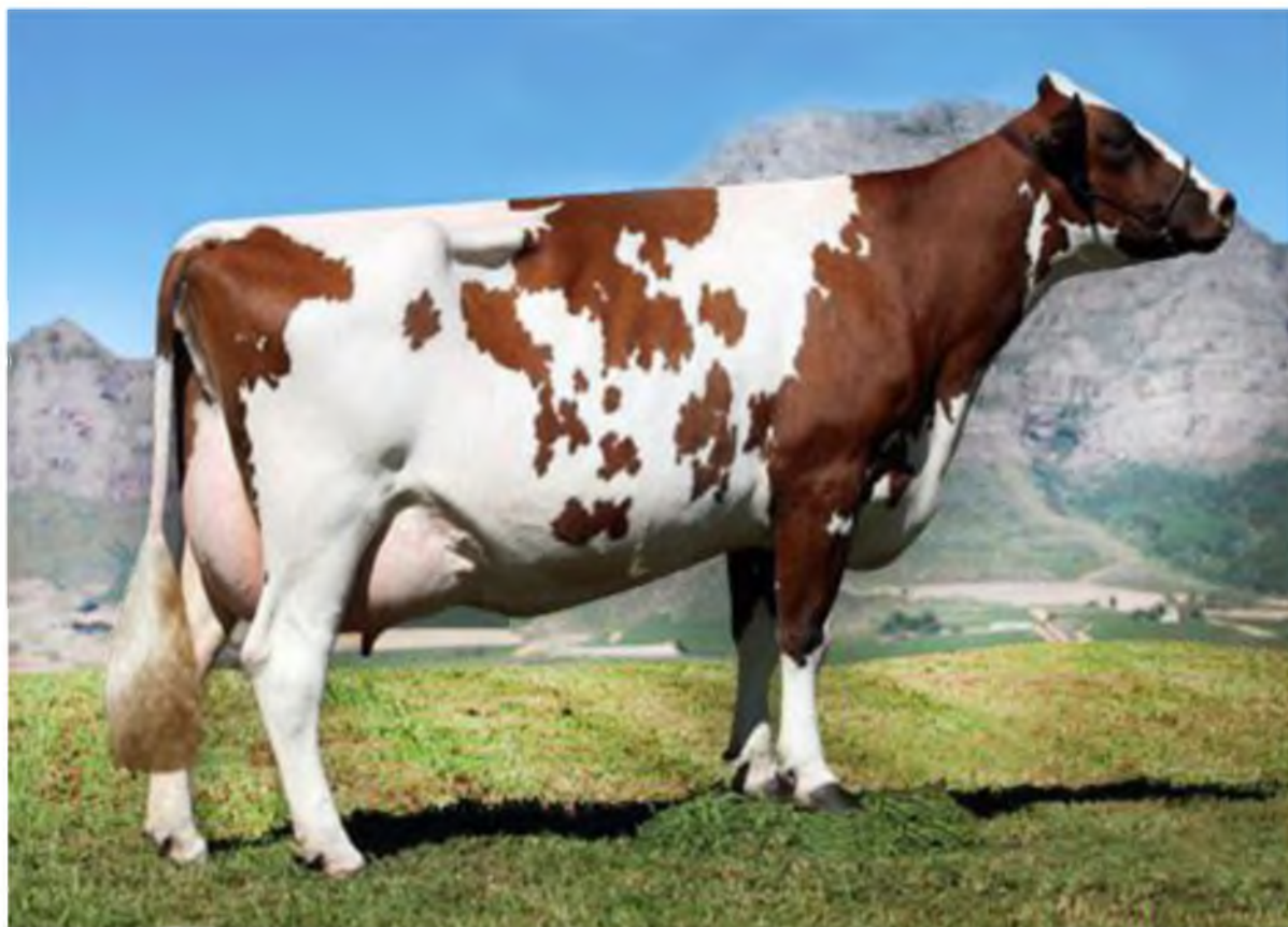
Корова айширской породы