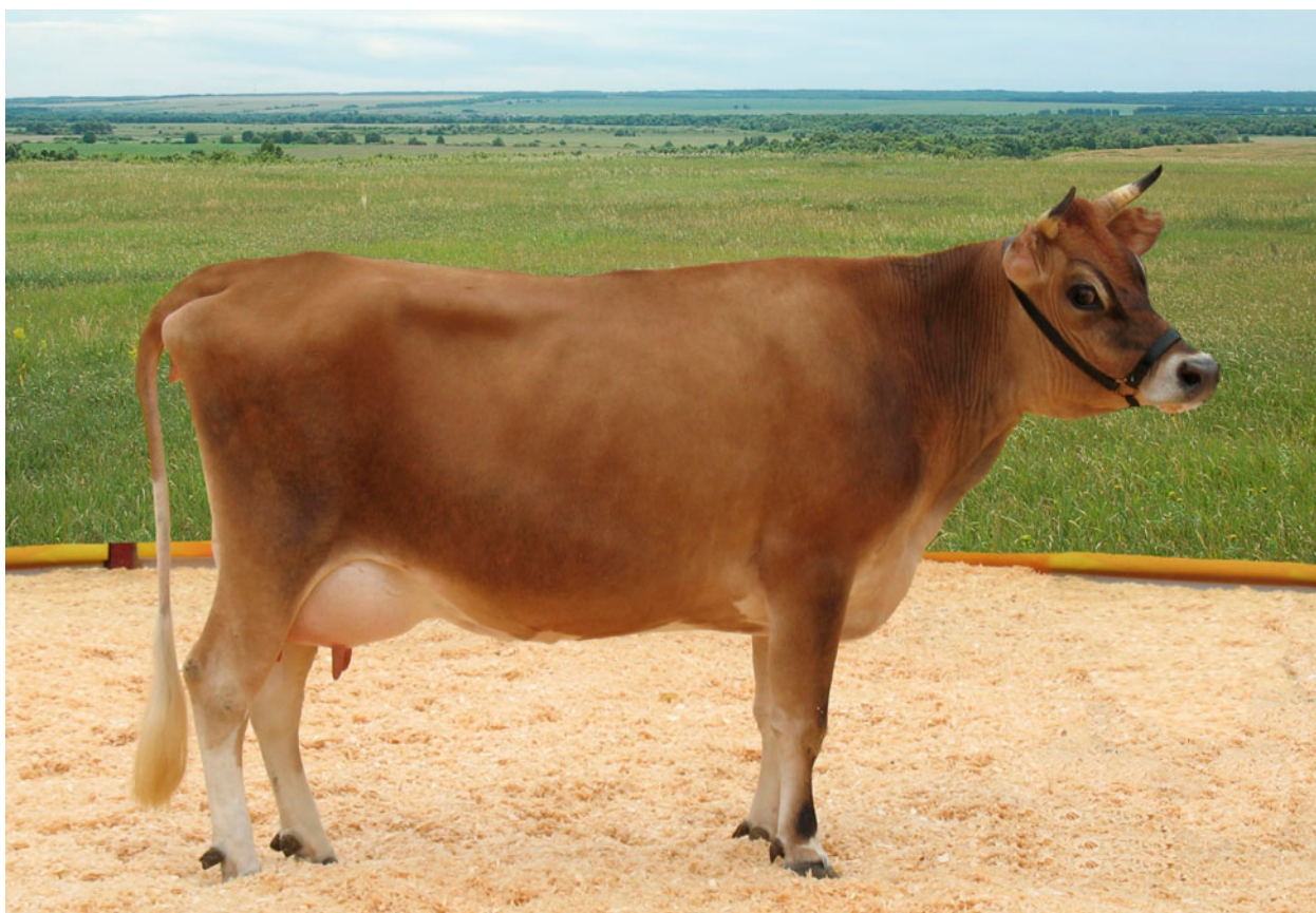
Корова джерсейской породы