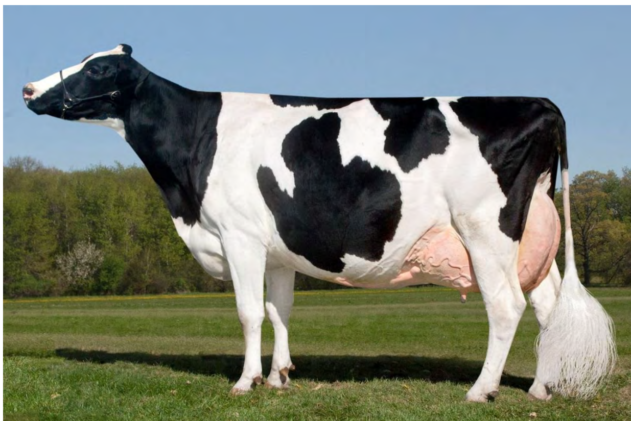
Корова голштинской породы